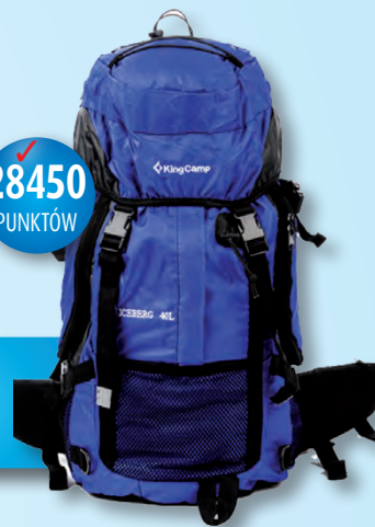
U135 Plecak turystyczny