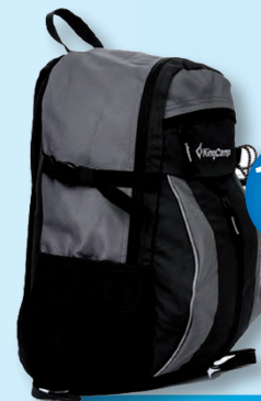
U136 Plecak miejski